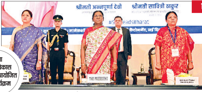
अंतरराष्ट्रीय महिला दिवस के कार्यक्रम में राष्ट्रपति

महिला एवं बाल विकास मंत्रालय ने आयोजित किया कार्यक्रम