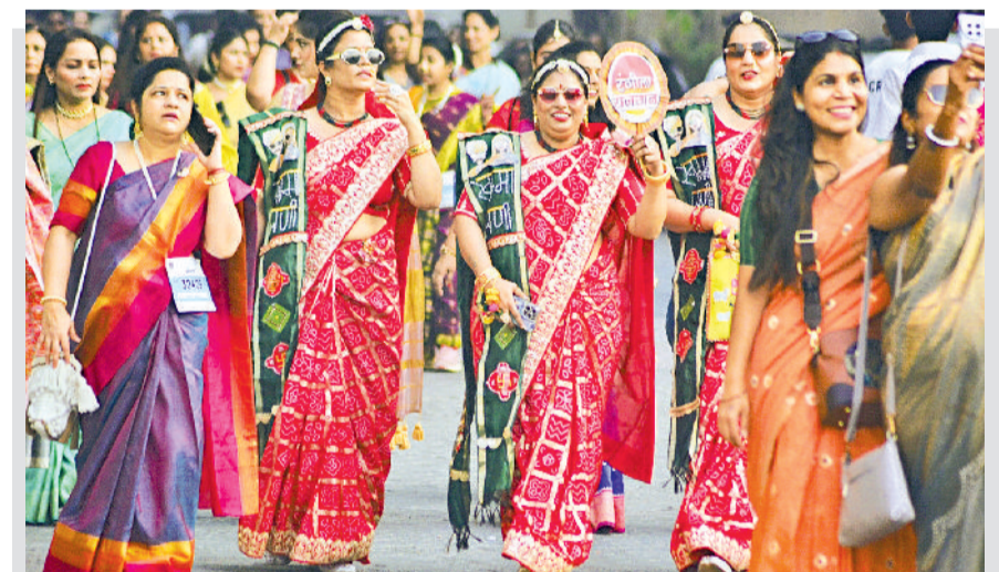
राष्ट्रपति ने कहा कि भारत महिला नेतृत्व वाले विकास को ओर तेजी से अग्रसर है। एक दशक में मार्ग में आने वाली बाधाओं को दूर करने के लिए मजबूत आधार तैयार किया गया है। भारत ने स्कुली शिक्षा में लैंगिक समानता हासिल कर ली है।